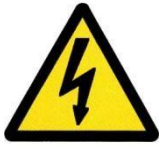
Pericolo tensione elettrica